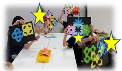
黒ひげ先生の造形あそび 「花火♪」