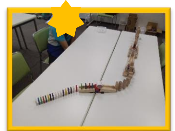
～工作～ からくり装置を作って遊びました！