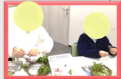
はッピー工作ではリースを作りました🎄