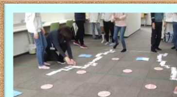
レクリエーション♪