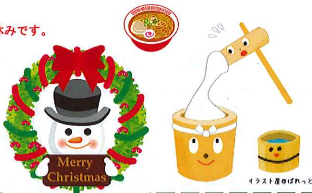
イラスト屋のぱれっと